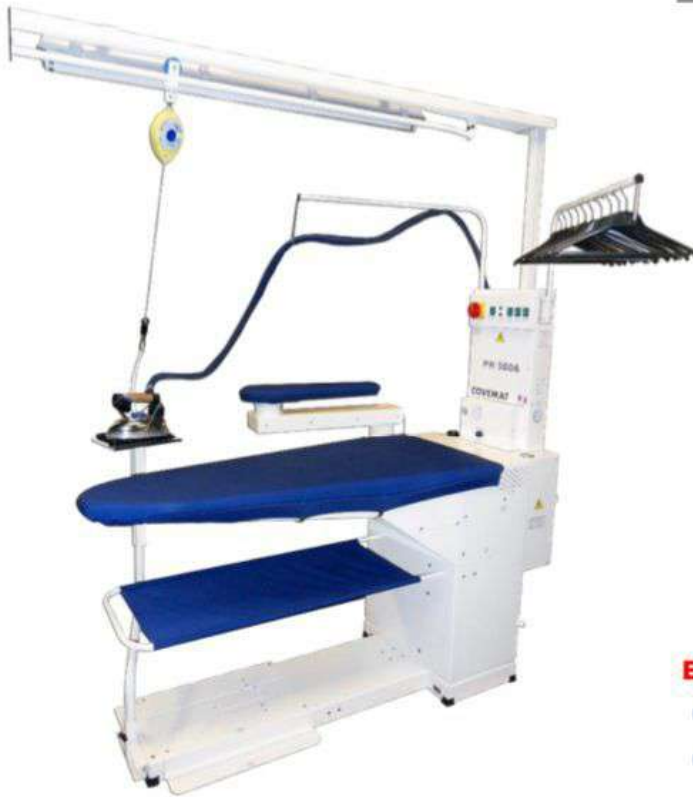
TABLE DE REPASSAGE TRIANGULAIRE CHAUFFANT, ASPIRANT, SOUFFLANT, VAPORISANT, REGLABLE EN HAUTEUR PAR RESSORTS A GAZ

Compact et autonome avec chaudière tout inox à raccorder sur réseau d'eau.